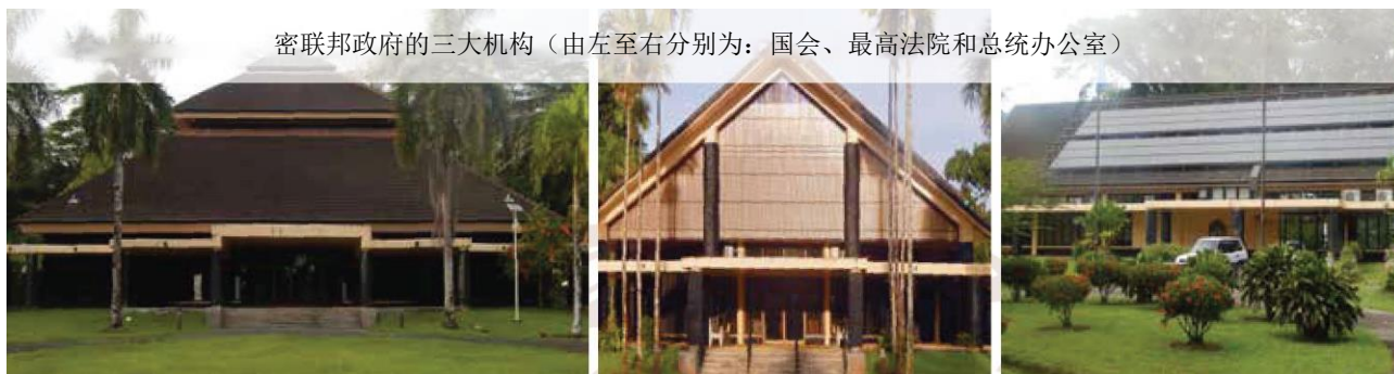
密联邦政府的三大机构（由左至右分别为：国会、最高法院和总统办公室）

密联邦宪法和美国宪法一样，实施三权分立制，将行政、立法和司法三种权力交由不同的国家机关管辖。密联邦国会是一院制，包含 14 名议员：四州各选出一名任期 4 年，其余 10 名任期 2 年，按人口比例在各州分配。目前，丘克州有 6 个议员席位，波纳佩州有 4 个，雅浦州和科斯雷州各有 2 个。总统和副总统任期 4 年，由国会从 4 年期议员中选出，议员空位由特别选举补选产生。密联邦最高法院领导国家政府的司法机构，由三名大法官组成，负责审理审判案件和上诉案件。各州政府也拥有类似的宪法结构，但由于各州情况不一，具体的政府构成也有所不同。