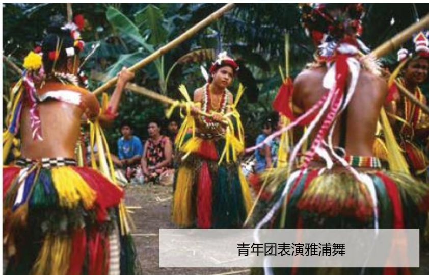
青年团表演雅浦舞

波纳佩州：文化同样丰富独特，传统社会由酋长南门瓦奇 (Nanmwarki) 和副酋长纳尼肯 (Naniken) 领导。