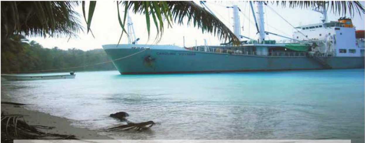
雅浦州埃拉托环礁旁的卡罗琳航海者号