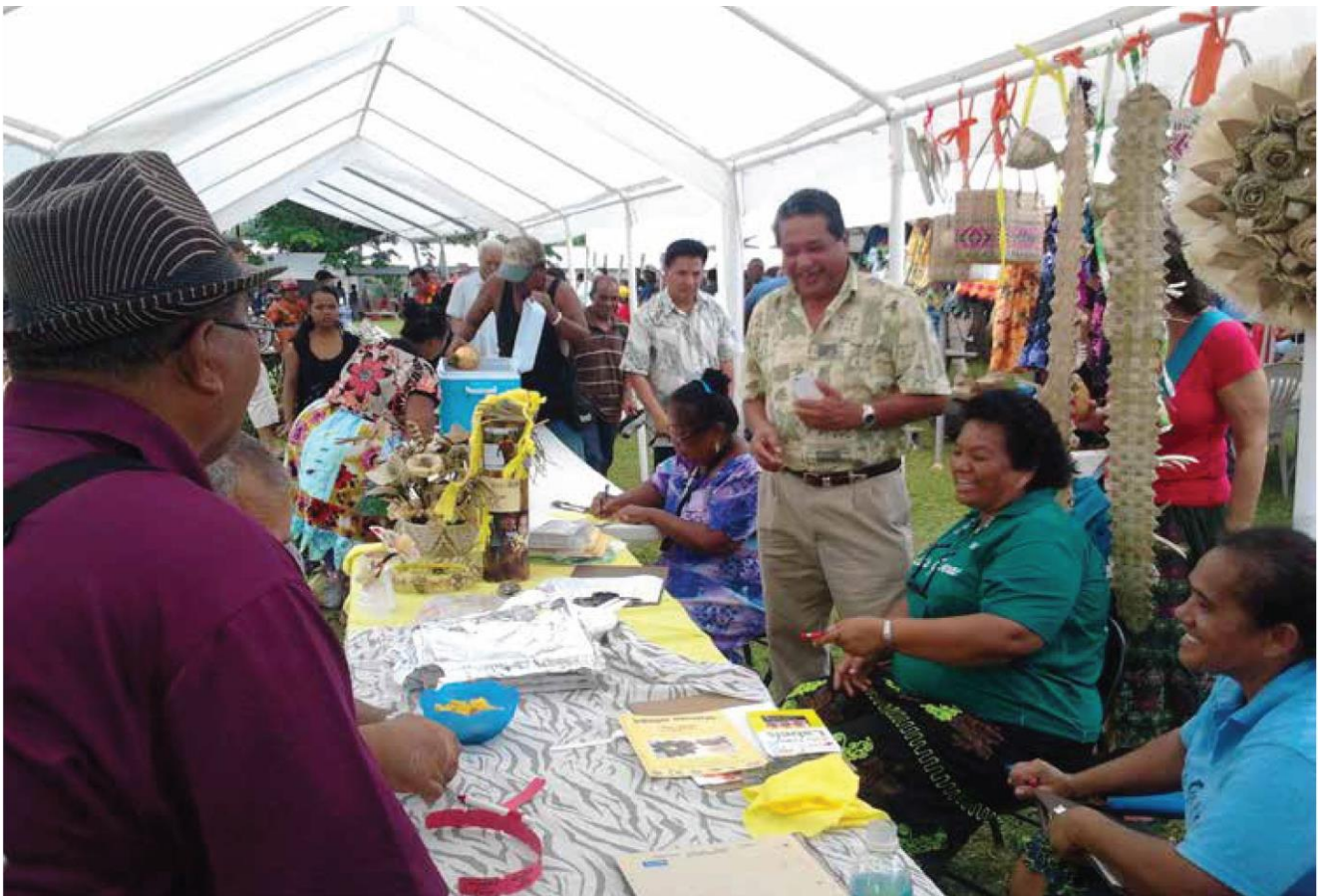
2013 年波纳佩贸易和文化博览会上展出的加工食品样品