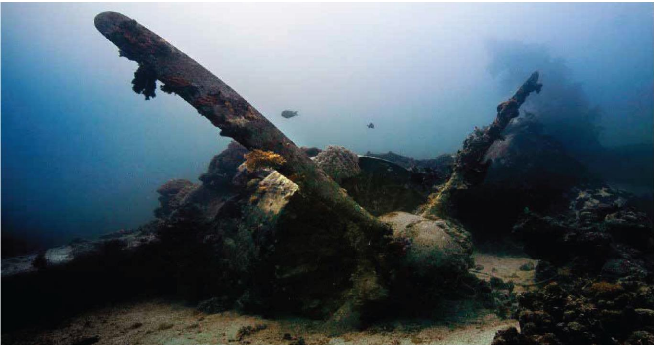
沉没在特鲁克泻湖底的二战战机，曾是著名的“特鲁克泻湖幽灵舰队”的一员。

鉴于中国游客数量不断增加，密联邦将很快开通连接香港和北京等亚洲主要枢纽的直航包机。