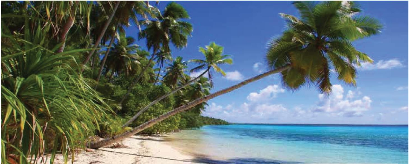
密联邦的壮丽海滩