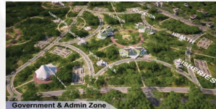
Government & Admin Zone