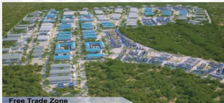
Free Trade Zone

靠近海港和机场，将提高运输和物流效率。该设施应包括进出口设施、包装/再包装设施、仓库和储存设施。