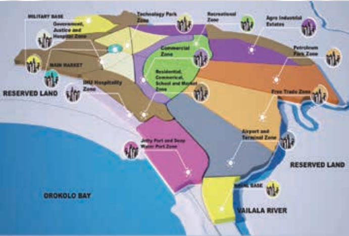
土地发展区：1.5万公顷