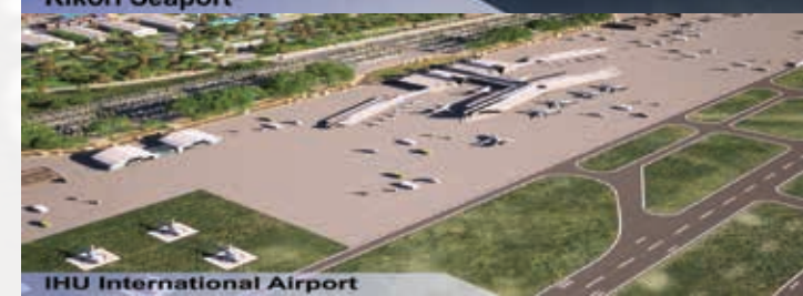
Ihu International Airport